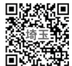
埼玉医療福祉専門学 出願サイト