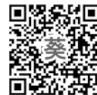
葵メディカルアカデミー 出願サイト